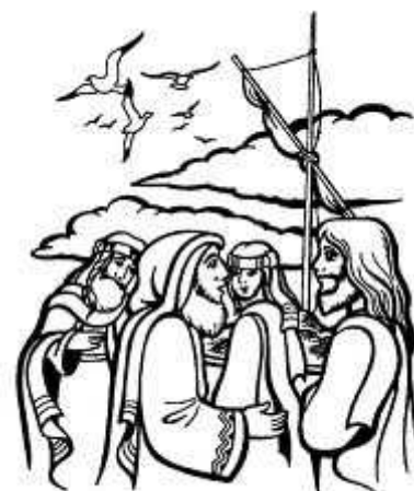
Accresci la nostra fede

Antifona al Salmo: Ascoltate oggi la voce del Signore